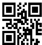
Contoh QR code

An. BUPATI/WALIKOTA/KEPALA PTSP KABUPATEN/KOTA ..... KEPALA LEMBAGA PENGELOLA DAN PENYELENGGARA OSS