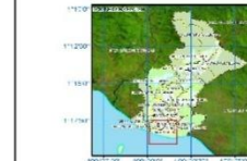
DIAGRAM I OKASI