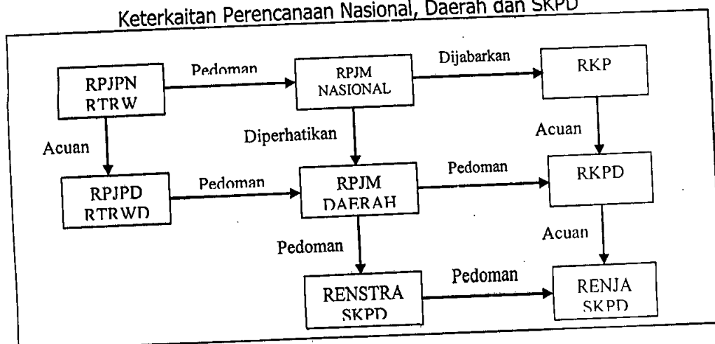
Gambar 1.1 Keterkaitan Perencanaan Nasional, Daerah dan SKPD

Perencanaan pembangunan daerah merupakan satu kesatuan dalam sistem perencanaan pembangunan nasional. Ruang lingkup perencanaan pembangunan daerah yang meliputi tahapan, tata cara penyusunan, pengendalian dan evaluasi pelaksanaan rencana pembangunan daerah, yang terdiri atas RPJPD, RPJMD, Renstra SKPD, RKPD, dan Renja SKPD. Disamping itu, Perencanaan pembangunan daerah juga mengintegrasikan rencana tata ruang dengan rencana pembangunan daerah.