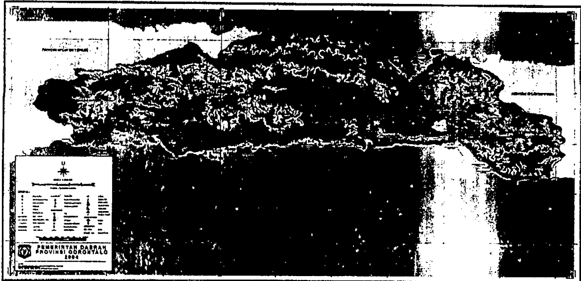
Gambar 2.1 Peta Provinsi Gorontalo

Wilayah Provinsi Gorontalo dengan Luas 12.215,44 km 2 , hanya sebesar 0,63 persen dari luas wilayah Indonesia. Provinsi Gorontalo memiliki 6 (enam) wilayah administrasi pemerintahan, yakni 5 (lima) Kabupaten dan 1 (satu) Kota yang terdiri dari Kota Gorontalo dengan luas wilayah 66,25 km 2 , Kabupaten Gorontalo dengan luas wilayah 2.207,58 km 2 , Kabupaten Boalemo dengan luas wilayah 2.517,36 km 2 , Kabupaten Pohuwato dengan luas wilayah 4.244,31 km 2 , Kabupaten Bone Bolango dengan luas wilayah 1.889,04 km 2 dan Kabupaten Gorontalo Utara dengan luas wilayah 1.676,15 km 2 .