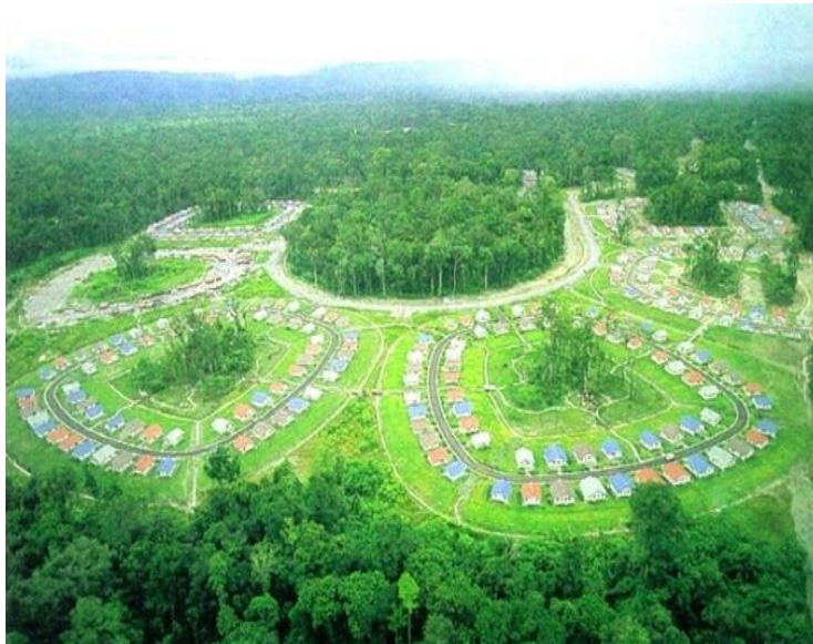
Gambar 5.21 Kawasan Kuala Kencana

Kawasan Kuala Kencana merupakan kota modern yang ada di Kabupaten Mimika. Kawasan ini sangat bersih dan tertata rapi karena dikelola sepenuhnya oleh PT Freeport Indonesia. Sebenarnya kawasan ini bukan merupakan kawasan wisata tapi pesona kawasan ini mampu menarik perhatian wisatawan yang berkunjung ke Papua. Kawasan ini mempunyai potensi untuk dijadikan kawasan wisata, untuk itu perlu adanya pengembangan kawasan agar kawasan ini menjadi layak untuk menjadi kawasan wisata.