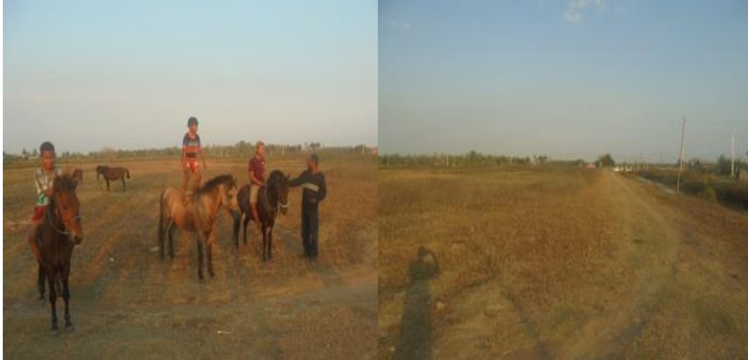
Gambar 5.28 Pacuan Kuda Sidomulyo

Merauke memiliki pacuan kuda terbesar di Provinsi Papua. Pacuan Kuda Sidomulyo sudah sering digunakan sebagai arena pacuan. Tentu saja arena pacuan kuda ini memiliki potensi untuk dikunjungi sebagai kawasan pariwisata minat khusus. Untuk itu perlu dikembangkan agar arena ini menjadi kawasan wisata yang sangat menarik untuk dikunjungi.