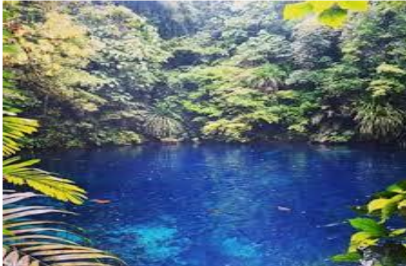
Gambar 5.23 Danau Biru

Salah satu danau yang ada di Biak Numfor ini memiliki keindahan alam yang tak ada tandingannya. Warna air Danau Biru yang sangat jernih sangat menenangkan, ditambah lagi lingkungan sekitarnya yang banyak ditumbuhi oleh tumbuhan sehingga tercipta ekosistem alam yang indah. Sebagai destinasi pariwisata Danau Biru perlu dilengkapi dengan jalan terapung untuk memudahkan aksesibilitas para wisatawan. Selain itu perlu adanya homestay di sekitar danau agar wisatawan dapat menikmati bermalam di kawasan Danau Biru.