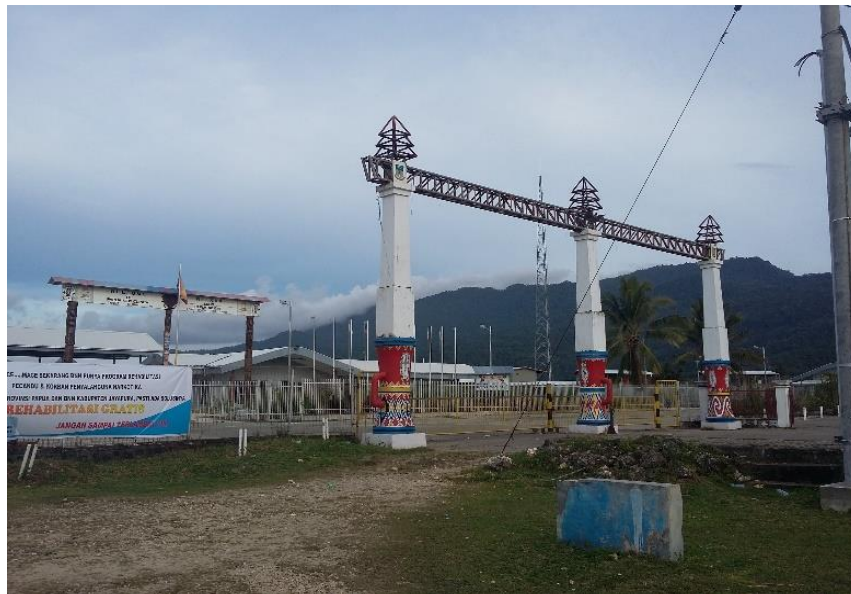
Gambar 5.8. Perbatasan Skow