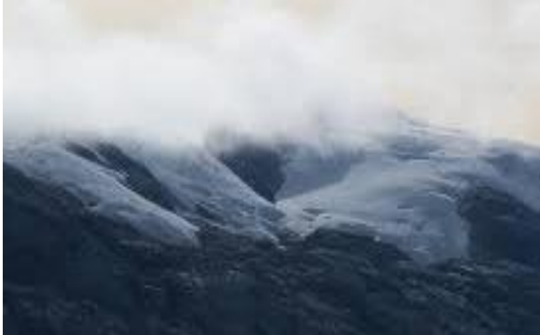
Gambar 5.20 Puncak Cartens Kabupaten Mimika

Puncak Cartens merupakan salah satu tujuan wisata favorit khususnya bagi para pendaki. Puncak Cartens memiliki ketinggian 5.030 mdpl menurut Australian Navigation Air Maps. Maka dari itu, kawasan wisata Puncak Cartens perlu dikembangkan dan juga ada pengelolaan kawasan.