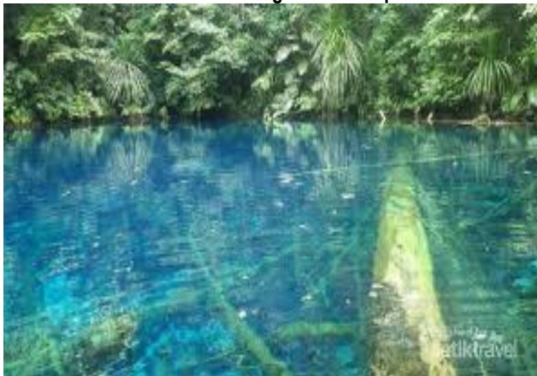
Gambar 5.27 Telaga Biru Kabupaten Merauke

Telaga Biru merupakan salah satu objek wisata yang ada di Kabupaten Merauke. Tekaga ini memiliki air yang jernih dan lingkungan sekitarnya terdapat tumbuhan yang menjadi ekosistem alami. Untuk itu perlu dibangun jalan terapung dan homestay. Fasilitas tersebut memberikan kemudahan bagi wisatawan yang berkunjung ke Telaga Biru.