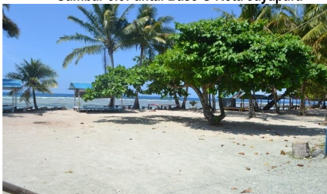
Gambar 5.5 Pantai Base G Kota Jayapura

Pantai Base-G merupakan salah satu destinasi wisata pantai di Kota Jayapura. Saat ini, Pantai Base-G menjadi primadona warga lokal untuk menikmati alam laut. Melihat potensi pariwisata yang ada di Pantai Base-G maka perlu diperbaiki lagi, apalagi pantai ini juga akan menjadi destinasi wisata bagi delegasi PON XX di Papua. Hal yang perlu diperbaiki di Pantai Base-G adalah sarana dan prasarananya, seperti pembangunan gazebo untuk menikmati pantai sambil duduk-duduk santai, pondokan untuk menikmati bermalam di pantai, dan toilet sebagai fasilitas penting yang menunjang kegiatan wisata di sana.