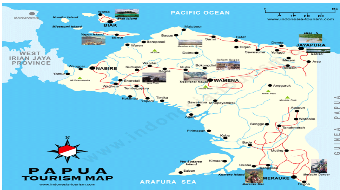
Gambar 5.3. Peta Sebaran Objek Daya Tarik Wisata Provinsi Papua

Untuk mendukung akomodasi wisatawan, keberadaan hotel sangat penting. Tabel 6.2. menunjukkan jumlah hotel yang ada di 6 kabupaten/kota lokasi PON XX pada tahun 2013.