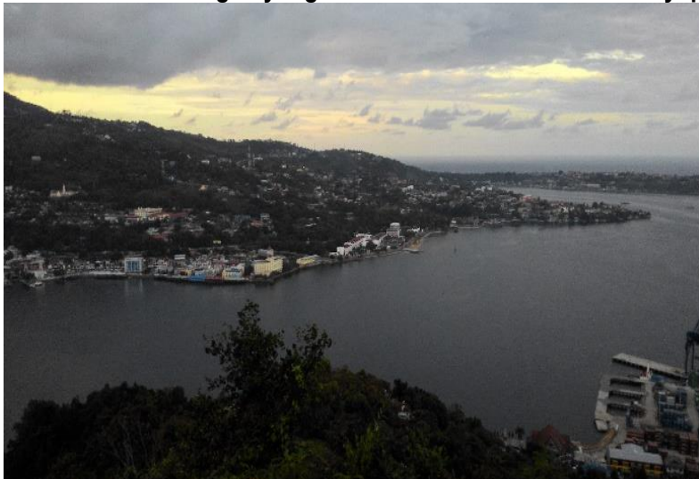
Gambar 5.6 Pemandangan yang Terlihat dari Kawasan Bukit Jayapura City