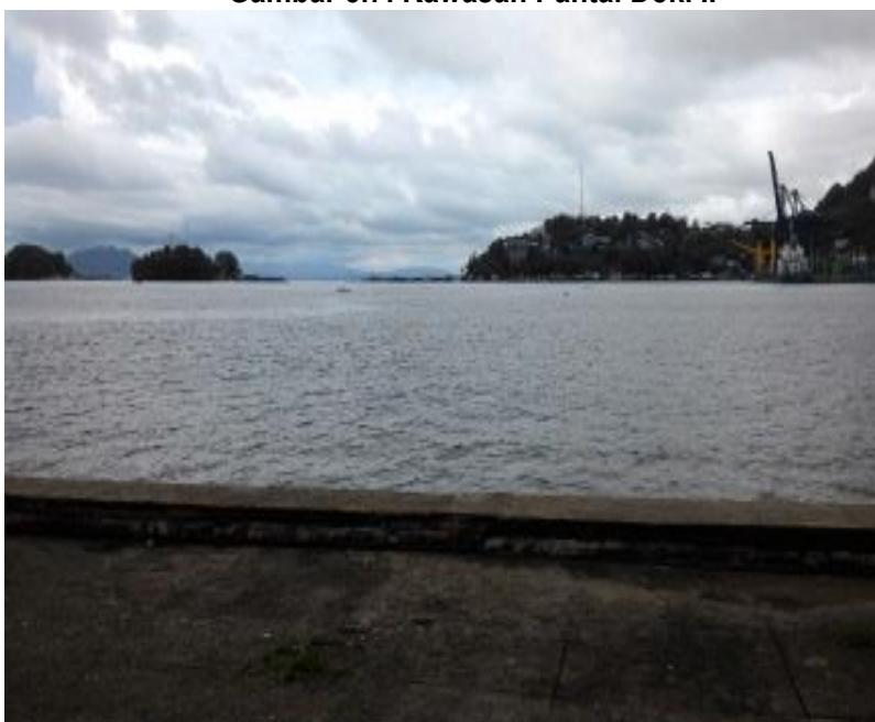
Gambar 5.7. Kawasan Pantai Dok. II

f. Penataan tempat duduk dan taman di Perbatasan Skow;