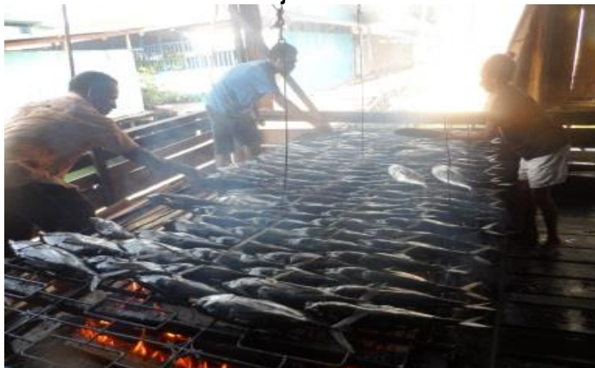
Gambar 5.11 Sentra Penjualan Ikan Asar Pantai Hamadi

Selain memiliki alam pantai yang indah, Pantai Hamadi juga terkenal dengan ikan asar. Para pencari ikan banyak yang menjual hasil tangkapannya di pantai ini. Masyarakat sekitar pun sudah mengenal Pantai Hamadi sebagai pusat penjualan ikan dan peralatan penangkap ikan. Hal tersebut menjadi daya tarik menarik Pantai Hamadi sebagai sentra penjualan ikan. Untuk mendukungnya, maka perlu dibangun pasar atau outlet penjualan yang lebih menarik.