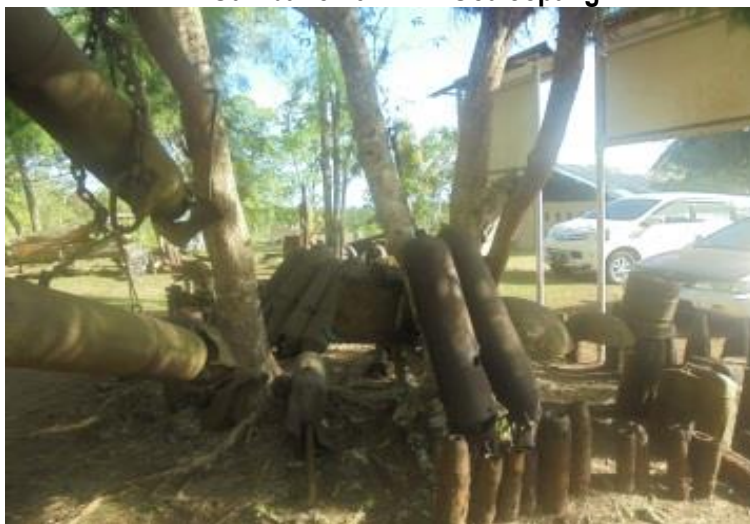
Gambar 5.26 Goa Jepang

Objek daya tarik wisata sejarah yang menarik dikunjungi di Kabupaten Biak Numfor adalah Goa Jepang. Goa peninggalan tentara Jepang di tanah Papua ini sangat cocok untuk wisatawan yang suka akan sejarah. Kawasan Goa Jepang ini perlu dilakukan penataan agar menjadi lebih menarik untuk dikunjungi.