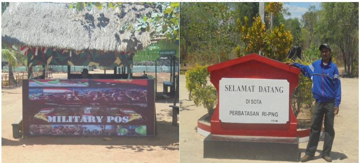
Gambar 5.29 Kawasan Perbatasan Sota

Kawasan perbatasan dua negara tentu menjadi daya tarik tersendiri untuk dikunjungi, salah satunya adalah di kawasan Sota, Kabupaten Merauke. Kawasan Sota terletak di Distrik Sota yang berjarak sekitar 80 km dari Kota Merauke. Sebagai ibukota distrik, kawasan ini menjadi pusat perdagangan, tidak hanya warga lokal tetapi warga Papua Nugini juga sering berbelanja di kawasan ini. Tugu perbatasan memang menjadi daya tarik sendiri karena wisatawan dapat berada di kawasan ujung timur Indonesia. Maka dari itu, kawasan tersebut dapat dikembangkan dengan cara pembangunan homestay bagi wisatawan yang mau menginap di kawasan tersebut.