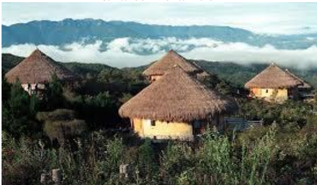
Gambar 5.32 Lembah Baliem

Lembah Baliem adalah lembah yang ada di Pegunungan Jayawijaya. Di lembah ini terdapat permukiman penduduk warga lokal yang terdiri atas berbagai suku, diantaranya adalah Suku Dani, Suku Yali, dan Suku Lani. Sudah jelas kondisi lingkungan di Lembah Baliem sangatlah indah ditambah lagi hawa dingin pegunungan yang jarang didapatkan di kawasan perkotaan. Daya tarik Lembah Baliem tidak hanya pada kondisi lingkungan alamnya yang indah, di Lembah Baliem juga sering diadakan Festival Lembah Baliem. Festival ini berupa ajang adu antar-suku yang telah berlangsung secara turun-temurun sebagai lambang kesuburan dan kesejahteraan yang tentunya dapat dinikmati oleh para wisatawan.