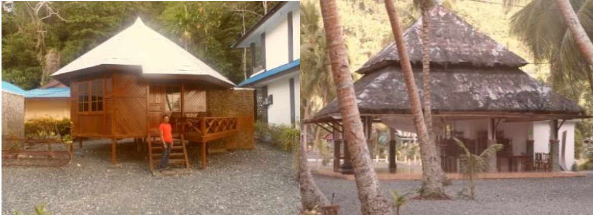
Gambar 5.16 Pantai Tablanusu

Pantai Tablanusu merupakan salah satu objek wisata di Kabupaten Jayapura tepatnya di Distrik Depapre. Terletak sekitar 87 km sebelah barat Kota Jayapura pantai ini memiliki pesona lain yang tidak dimiliki oleh pantai-pantai lain di Jayapura. Pemandangan alam yang indah, banyaknya pohon kelapa yang membuat teduh kawasan pantai, dan hamparan batu koral kecil yang menutupi seluruh daratan di bibir pantai. Berbagai fasilitas wisata pun sudah tersedia di pantai ini seperti pemandu wisata, gereja, persewaan perahu, ubanan bot, restoran, dan pondokan yang dapat disewa. Meskipun semua itu sudah ada, perlu adanya renovasi restoran dan homestay agar memberikan kenyamanan bagi para wisatawan.