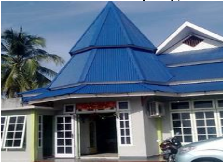
Gambar 5.12 Hotel Numbay Kota Jayapura

Pengembangan pariwisata berdampak positif bagi pengembangan ekonomi lokal. Adanya kawasan wisata akan membuat ekonomi lokal yang berbasis industri kreatif akan turut bangkit. Produk yang diminati untuk wisatawan adalah cinderamata khas dari Kota Jayapura. Kota Jayapura sendiri sudah memiliki produk lokal yang menarik seperti noken dan batik Papua. Untuk itu perlu ada dukungan pengembangan terhadap produk-produk lokal Papua yang dapat dilakukan seperti: