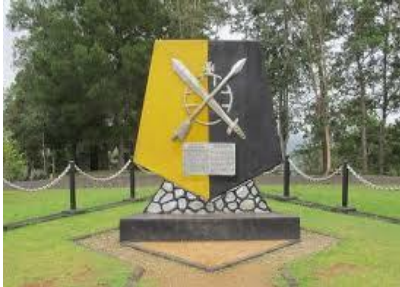
Gambar 5.14 Monumen Mark Arthur

Salah satu objek wisata yang di Kabupaten Jayapura yang sangat menarik adalah Monumen Jend. Mark Arthur yang terletak di atas bukit, di atas Danau Sentani, yang dikenal dengan daerah Ifar Gunung, atau sekarang lebih dikenal dengan Bukit Makatur. Monumen ini memadai bukti sejarah jejak Mark Arthur di Jayapura. Sebagai objek wisata sejarah yang memiliki potensi yang besar maka perlu dilakukan pemeliharaan dan penataan pada kawasan tersebut agar menjadi nyaman untuk dikunjungi dan tentunya memberikan manfaat edukasi bagi pengunjungnya.