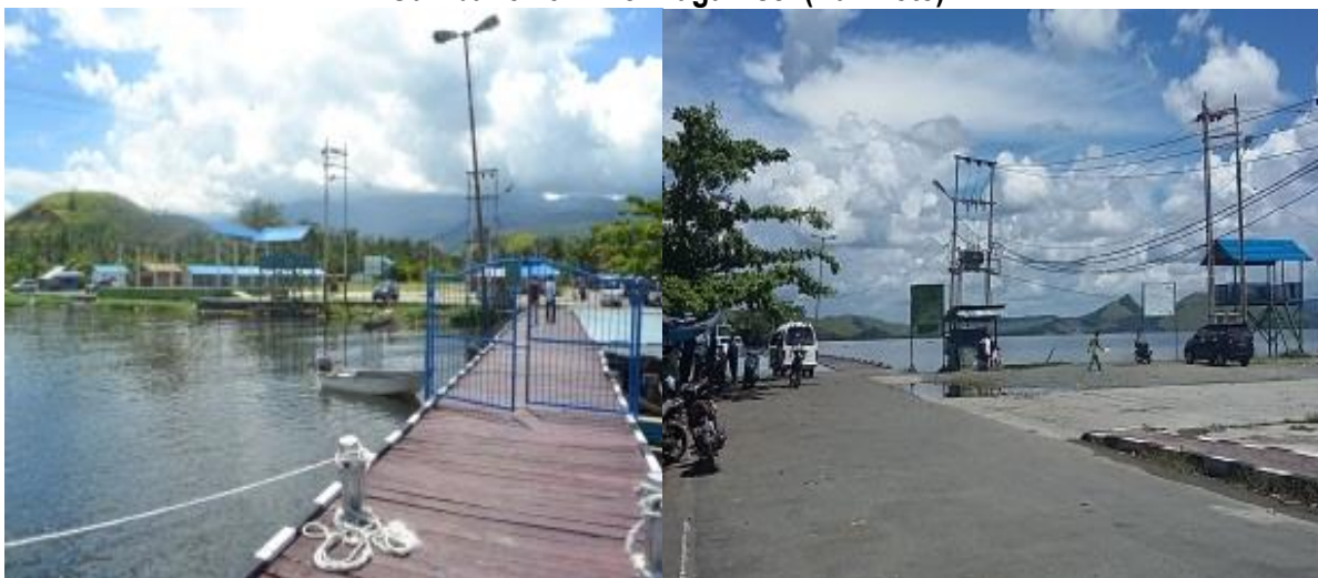
Gambar 5.13 Dermaga Asei (Kalkhote)

Pulau Asei merupakan salah satu dari 21 pulau yang ada di Danau Sentani, danau terluas yang ada di Papua. Pulau Asei menjadi destinasi wisata alam yang sangat menarik. Untuk menyeberang ke Pulau Asei dapat dilakukan dengan kapal kecil dari dermaga besar Sentani ke Dermaga Asei. Untuk mendukung pariwisata di Pulau Asei, maka Dermaga Asei di Pantai Kalkhote perlu direnovasi dan diperbaiki berbagai fasilitas pendukung wisatanya. Bagian-bagian yang perlu direnovasi antara lain dermaga itu sendiri, aula, toilet umum, dan perlu adanya pembangunan gerbang dan pondok wisata. Adanya gerbang masuk menuju dermaga menjadi penanda bahwa sudah berada di Pulau Asei. Selain itu, adanya pondok untuk mengomodir para wisatawan yang mau menginap dan menikmati bermalam di Pulau Asei.