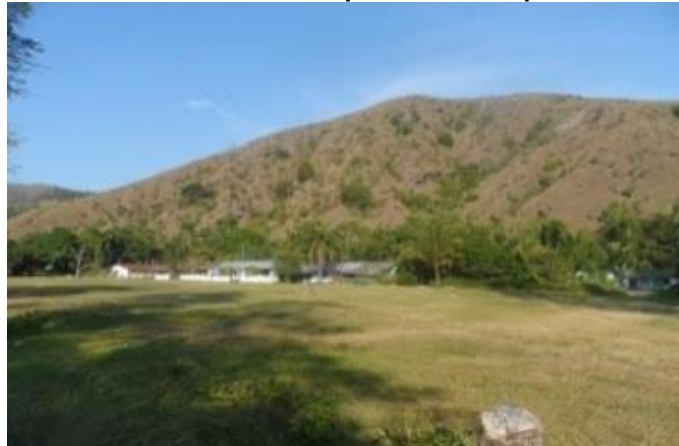
Gambar 5.17 Jalan Setapak Jalur Kamp Walker Kota NICA

Salah satu wisata sejarah yang dapat dinikmati di Jayapura adalah adanya jalan setapak. Jalan setapak ini merupakan rute perjalanan tentara Amerika pimpinan Jenderal Mark Arthur yang menghubungkan Hamadi – Sentani melalui Kota NICA atau Kampung Harapan. Sebagai destinasi wisata yang menarik maka jalan setapak ini perlu dibangun kembali sebagai tonggak sejarah berdirinya Kota Jayapura.