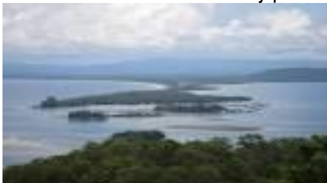
Gambar 5.4 Teluk Yotefa Kota Jayapura

Teluk Yotefa di Kota Jayapura mempunyai keindahan alam yang eksotis. Selain itu pula, teluk ini merupakan pintu masuk ke Kota Jayapura melalui jalur laut. Maka dari itu, sebagai gerbang menuju Papua, perlu dibangun dermaga yang sesuai. Dermaga bukan hanya dijadikan sebagai pintu masuk melainkan sebagai landmark pariwisata di Papua. Pembangunan jembatan apung juga diperlukan untuk mempermudah aksesibilitas wisatawan menuju dan dari Kota Jayapura.