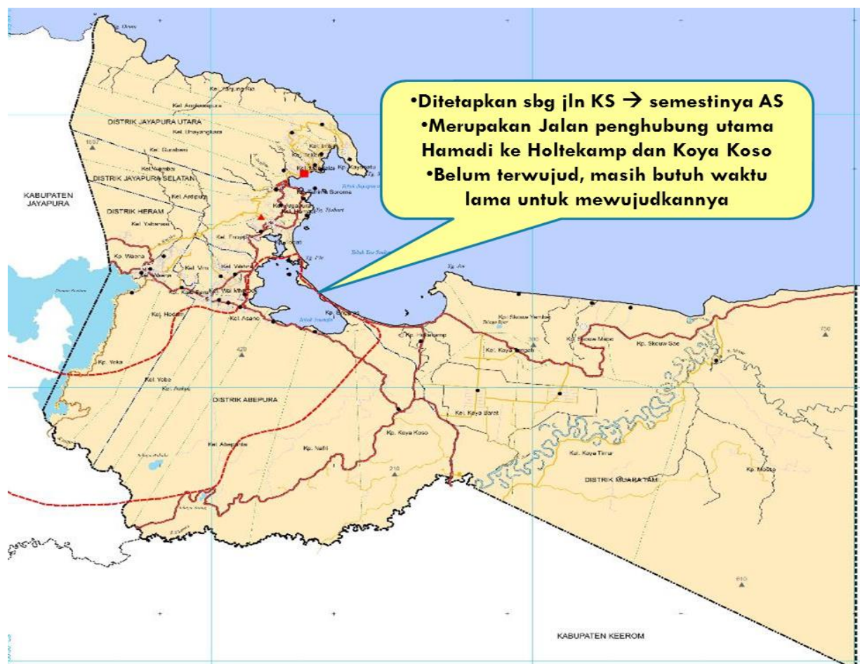
Gambar 5.1 Peta Rencana Fungsi Jalan di Kota Jayapura