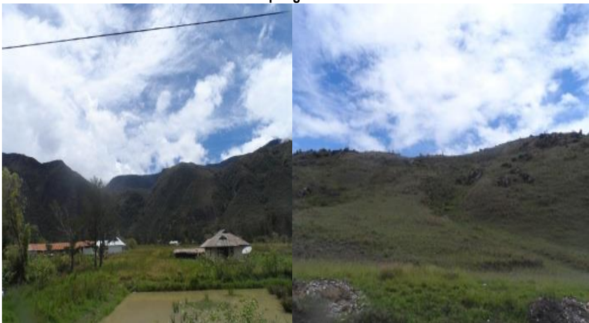
Gambar 5.30 Kampung Wisata di Distrik Kurulu

Distrik Kurulu yang berjarak sekitar 30 km dari Kota Wamena terdapat kampung wisata yang menarik untuk dikunjungi. Beberapa perkampungan di Distrik Kurulu didiami oleh Suku Dani Tradisional ini sangat menjaga keaslian tradisi terlihat dari pakaian adat dan budaya masyarakatnya. Untuk itu, perlu adanya penataan kampung wisata Distrik Kurulu agar dapat berkembang terus.