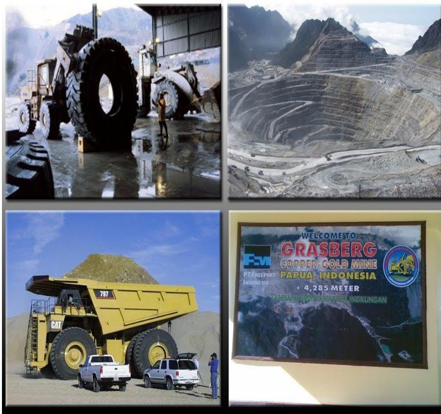
Kawasan G. Grassberg

Dalam mengembangkan perekonomian kreatif di Kabupaten Mimika maka perlu adanya pelatihan ketenagakerjaan untuk meningkatkan kemampuan dan sumberdaya masyarakat dalam mengelolanya. Pelatihan ketenagakerjaan tersebut diantaranya adalah pelatihan kuliner, pelatihan akomodasi, penguatan wirausaha, dan dibuatnya regulasi kebersihan pada masyarakat,