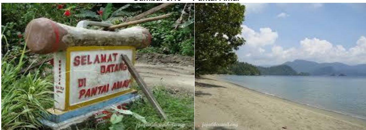
Gambar 5.19 Pantai Amai

Pantai Amai merupakan salah satu destinasi wisata pantai di Kabupaten Jayapura. Untuk mendukung destinasi wisata ini agar menjadi lebih berkembang, maka perlu ditambah beberapa fasilitas pendukung. Fasilitas pendukung yang perlu dibangun antara lain gazebo dan pondok. Gazebo dimaksudkan agar para pengunjung dapat duduk-duduk santai dan tidak kepanasan. Pondok dibuat agar pengunjung dapat menikmati bermalam di kawasan Pantai Amai.