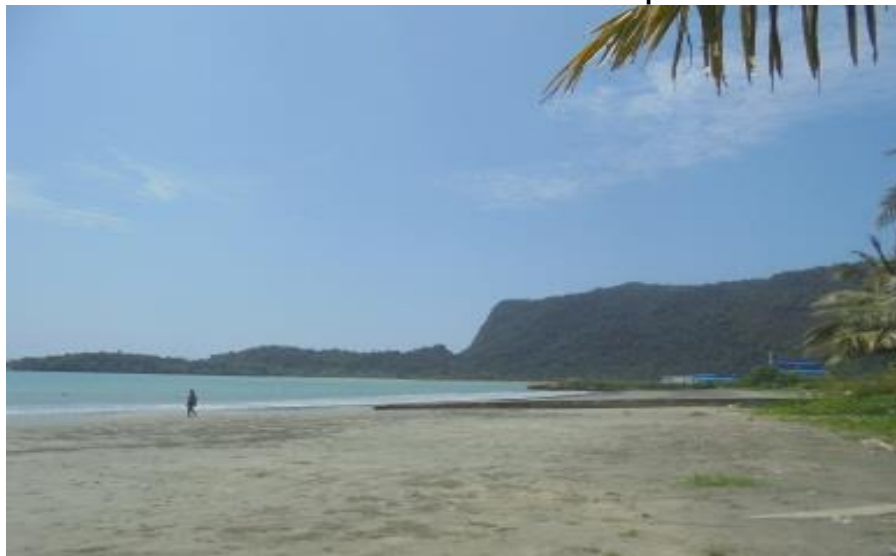
Gambar 5.10 Pantai Holtekamp