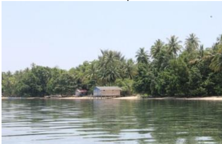
Gambar 5.24 Kepulauan Padaido

Kepulauan Padaido merupakan gugusan kepulauan kecil di Kabupaten Biak Numfor. Kepulauan Padaido menjadi objek wisata yang menarik untuk dikunjungi. Kepulauan Padaido juga sering menjadi tempat berkemah. Untuk mendukung pariwisata di kepulauan ini, maka perlu dibangun area basecamp dan beberapa homestay. Fasilitas tersebut tentu akan menjadi kemudahan dan menarik wisatawan ke Kepulauan Padaido.