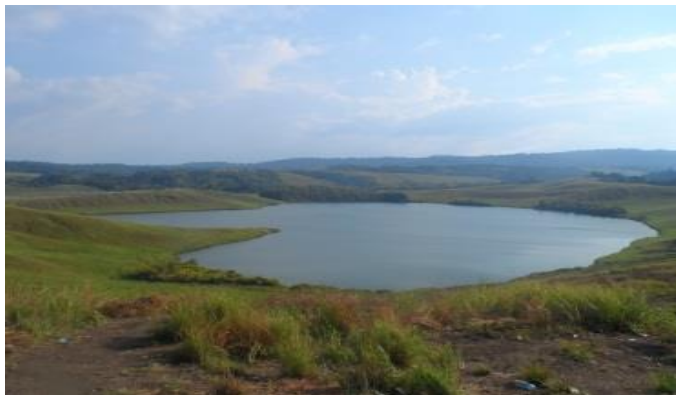
Gambar 5.18 Danau Love

Danau Love atau nama aslinya Danau Imfote merupakan salah satu danau yang ada di Distrik Sentani Timur. Danau ini menawarkan panorama alam yang indah dan menjadi destinasi favorit warga lokal. Eksistensi Danau Love juga semakin melejit, hal tersebut terbukti adanya wisatawan yang mengunjunginya. Lokasinya yang tidak jauh dari Kota Jayapura maupun Sentani memberikan potensi pariwisata yang kuat apalagi saat PON ke XX yang akan dilaksanakan di Papua tahun 2020 nanti. Untuk mengembangkan wisata di Danau Love perlu dibangun semi cottage agar wisatawan dapat menikmati bermalam di Danau Love.