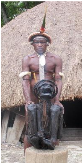
Gambar 5.31 Mumi di Goa Lokale