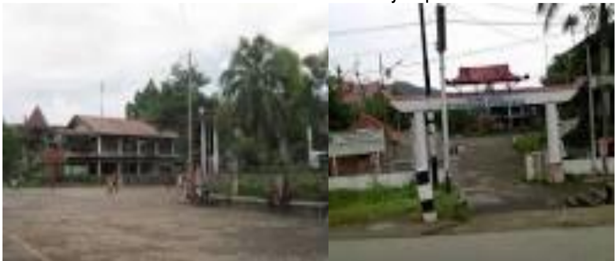
Gambar 5.15 Taman Budaya Papua

Taman Budaya Papua ini merupakan destinasi wisata budaya di Provinsi Papua. Taman Budaya Papua menjadi pusat kegiatan kebudayaan Provinsi Papua. Segala informasi tentang kebudayaan Papua terdapat di sini. Acara kesenian dapat ditampilkan di sini. Saat ini, kondisi Taman Budaya Papua kurang mendapatkan perhatian. Maka dari itu, untuk menjadi salah satu destinasi wisata di Kabupaten Jayapura, perlu ada renovasi dan pembangunan gedung. Hal ini agar Taman Budaya Papua bisa menjadi ikon kebudayaan yang mewakili seluruh wilayah Papua.