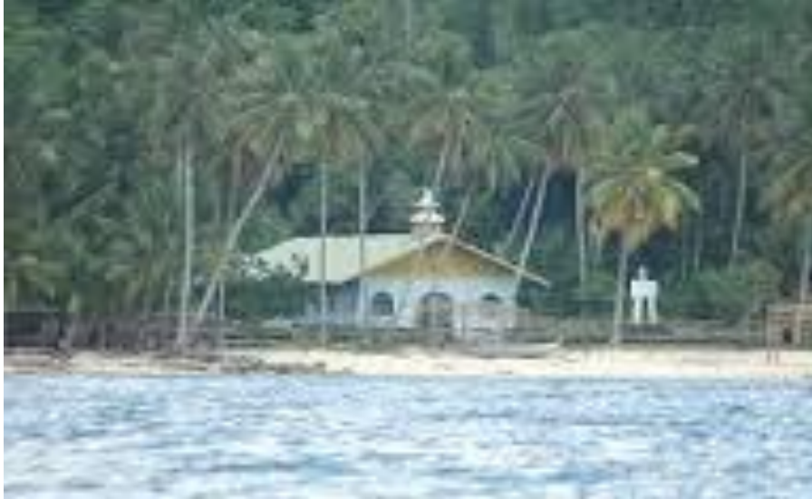
Gambar 5.25 Pulau Owi

Pulau Owi juga memiliki potensi untuk dikembangkan sebagai daya tarik wisata di Kabupaten Biak Numfor. Untuk memberikan akomodasi bagi para wisatawan yang ingin menginap di Pulau Owi, maka perlu dibangun beberapa unit homestay.