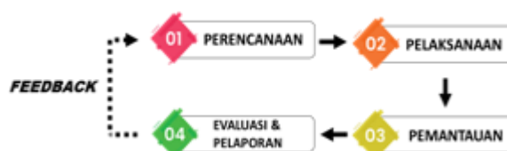
Gambar 5. Mekanisme Kerja Satuan Tugas SRA

Pembentukan Satuan Tugas SRA tingkat Provinsi/Kabupaten/Kota dilaksanakan melalui tahapan-tahapan yang terdiri dari: (1) perencanaan, (2) pelaksanaan, (3) monitoring, dan (4) evaluasi dan pelaporan.