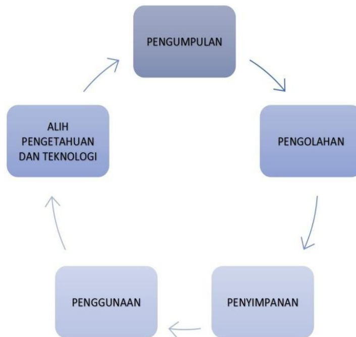
Gambar 3 Siklus Pelaksanaan Manajemen Pengetahuan SPBE

Pelaksanaan Manajemen Pengetahuan SPBE berpedoman pada siklus khusus Manajemen Pengetahuan SPBE sesuai Peraturan Presiden Nomor 95 tahun 2018 tentang SPBE yang dapat dijabarkan ke dalam langkah-langkah sebagai berikut :