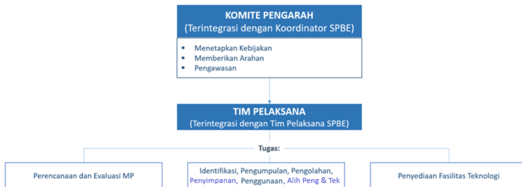
Gambar 2 Struktur Organisasi Manajemen Pengetahuan SPBE