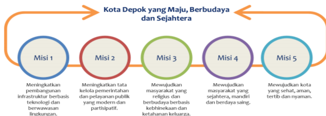
Gambar 3.1 Visi dan Misi Kota Depok, Tahun 2021-2026

Visi pembangunan Kota Depok dalam RPJMD Tahun 2021-2026 diterjemahkan kedalam 5 misi. Masing-masing misi diperinci ke dalam tujuan dan sasaran. Secara skematis misi, tujuan dan sasaran seperti yang tertuang dalam RPJMD Kota Depok Tahun 2021-2026 digambarkan pada tabel berikut: