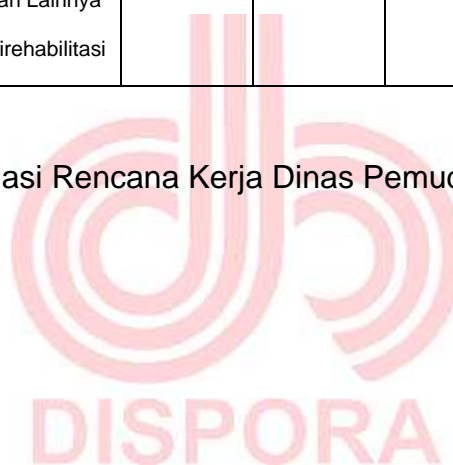
Tabel 2.2. Hasil Evaluasi Rencana Kerja Dinas Pemuda dan Olahraga Provinsi DKI Jakarta