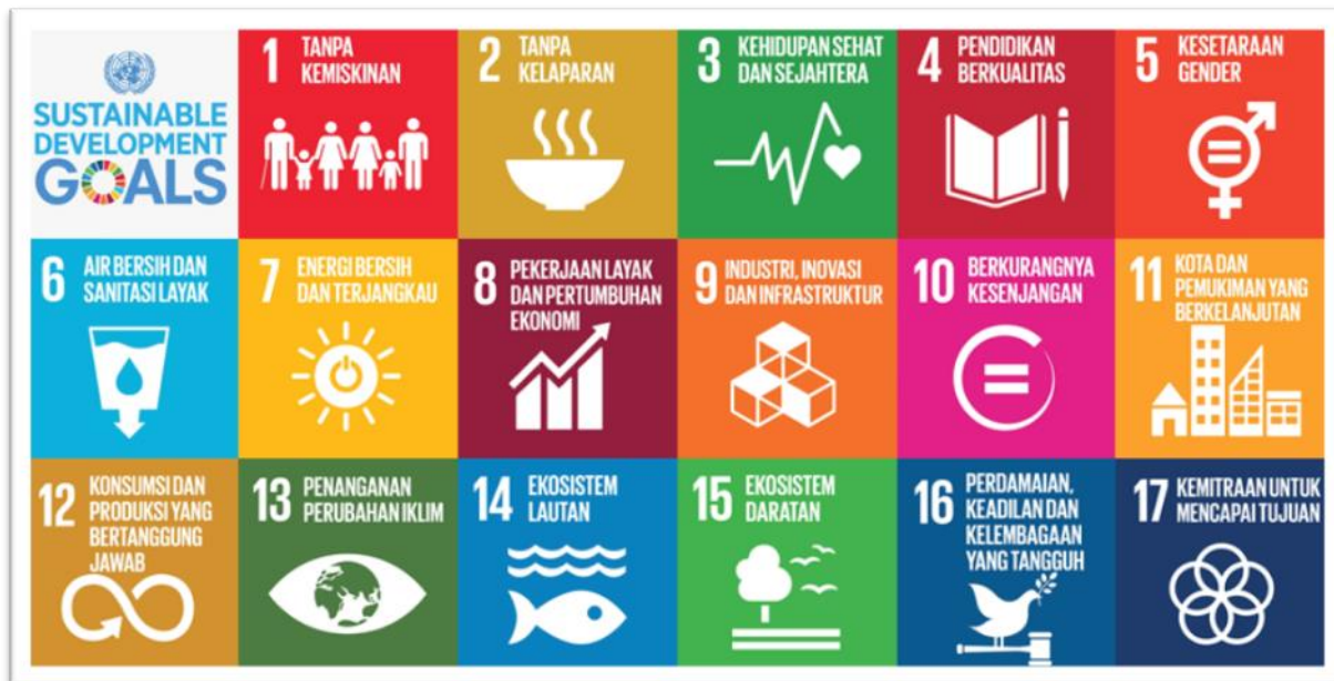
Gambar 3.1 Tujuan Pembangunan Berkelanjutan/Sustainable Development Goals (TPB/SDGs)

Dinas Dukcapil memiliki keterkaitan erat terhadap 3 (tiga) tujuan dari 17 Tujuan TPB/SDGs. Dua tujuan tersebut yaitu tujuan nomor 1, 16 dan 17: