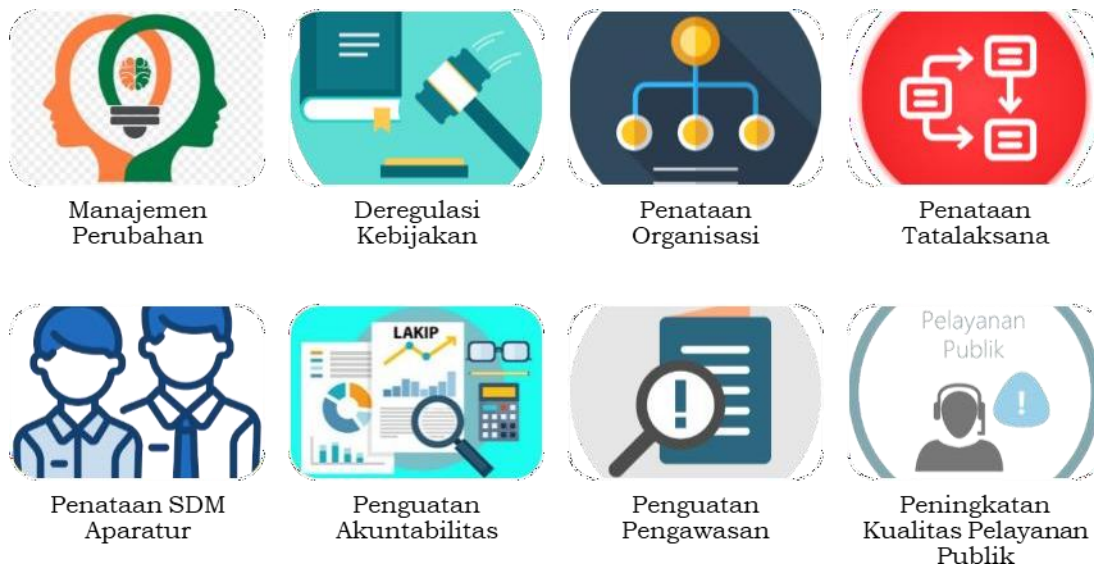
Gambar 2. Area Perubahan

Dari 8 ( delapan ) area perubahan dan indikator yang ada didalamnya menunjukkan bahwa pencapaian Akuntabilitas Kinerja diusulkan menjadi target yang diprioritaskan dengan alasan bahwa Akuntabilitas Kinerja menjadi pengungkit bagi indikator yang lain. Upaya pencapaian indikator diharapkan menjadi pencapaian indikator lainnya.