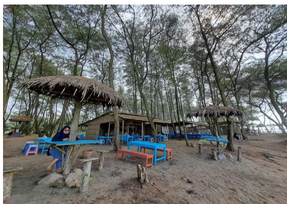
Gambar 4.2 Kondisi eksisting Pantai Pandan Kuning