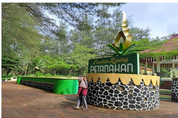
Gambar 4.1 Tugu Pantai Pandan Kuning

Pantai Pandan Kuning berlokasi di Desa Karanggadung, Kecamatan Petanahan. Pantai ini berjarak kurang lebih 13.38 km dari pusat kota Kebumen dan 675 dari JJLS. Untuk menuju kawasan wisata Pantai Pandan Kuning, pengunjung dapat menggunakan jalur angkutan umum maupun kendaraan pribadi. Akses jalan menuju lokasi tersebut juga sudah beraspal dan relatif besar. Pengembangan objek wisata Pantai Pandan Kuning mengambil tema Beach Park. Secara sederhana, konsep Beach Park diterjemahkan sebagai tempat hiburan tematik dengan mengusung tema-tema tertentu. Salah satu konsep pengembangan tersebut diharapkan akan membawa suasana kawasan, tampilan eksterior dan interior bangunan, elemen landscape pengolahan ruang terbuka, maupun sesuatu yang ditangkap oleh indra lain dapat dinikmati serta dapat di arahkan menjadi eduwisata/tempat belajar bagi pengunjung obyek wisata.