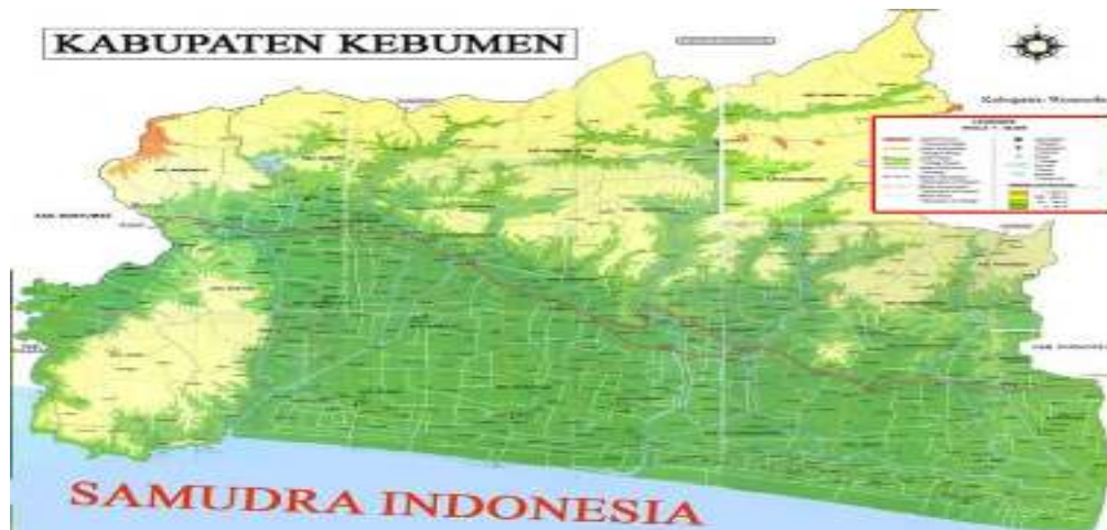
Gambar 1 Peta Kabupaten Kebumen

Luas wilayah Kabupaten Kebumen adalah 128.111,50 hektar yang terbagi dalam 26 kecamatan, terdiri dari 449 desa dan 11 kelurahan.