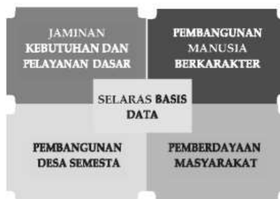
Gambar 4. Lima Fokus Koordinasi Kemenko PMK