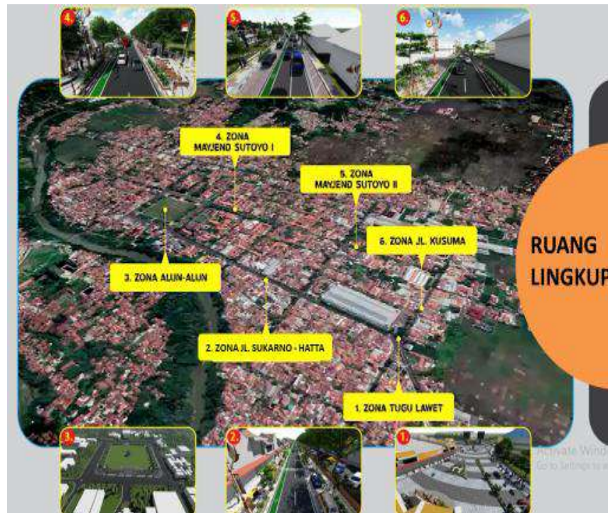
Gambar 4.1. Ruang Lingkup Koridor Jalan Arteri Primer Wilayah Perkotaan Kebumen

Dengan adanya penataan dan pengembangan koridor perkotaan diharapkan dapat memberikan efek multiplier bagi perekonomian dan kehidupan sosial, yang ditandai dengan meningkatnya pelaku pasar, pertokoan, UMUM dan meningkatkan keindahan, kebersihan dan ketertiban kawasan perkotaan. Penataan koridor perkotaan Kebumen mendukung program unggulan KUMPUL BAKUL dan JAMU SEGER (Jalan Mulus Ekonomi Bergerak) dalam rangka pemulihan ekonomi terdampak Pandemi Covid-19.