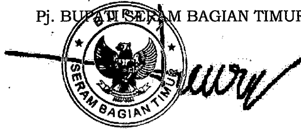
HENRI M FAR FAR