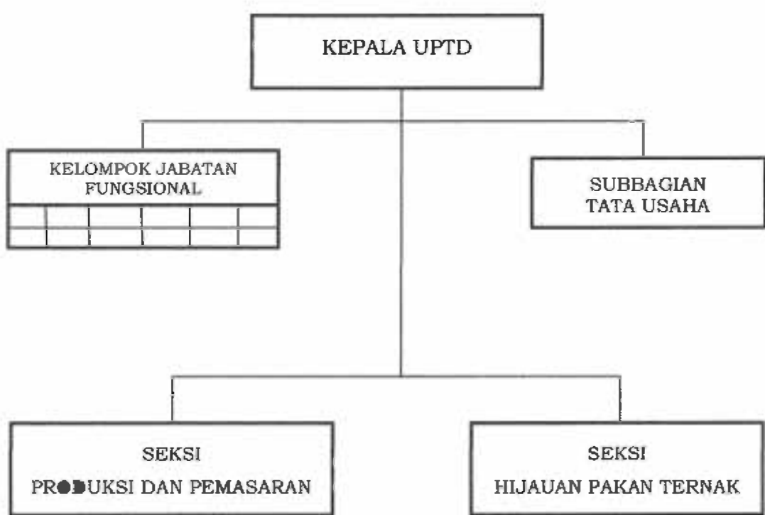
BAGAN SUSUNAN ORGANISASI UPTD BALAI PEMBIBITAN DAN HIJAUAN PAKAN TERNAK