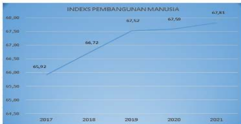
Gambar 3.3. Indeks Pembangunan Manusia (IPM) Kabupaten Majalengka