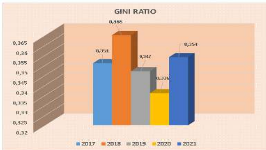
Gambar 3.2. Perkembangan Gini Ratio Kabupaten Majalengka

Sumber: BPS Kabupaten Majalengka, Tahun 2022.