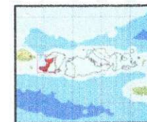
Kabupaten Lombok Barat

Sistem Proyeksi : Transversal Mercator Sistem Grid : Grid Geografi dan Grid Universal Transverse Mercator Datum Horizontal : SRGI 2013