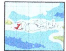
Kabupaten Lombok Barat

Sistem Proyeksi : Transversi Mercator Sistem Grid : Grid Geografi dan Grid Universal Transverse Mercator Datum Horizontal : SRGI 2013