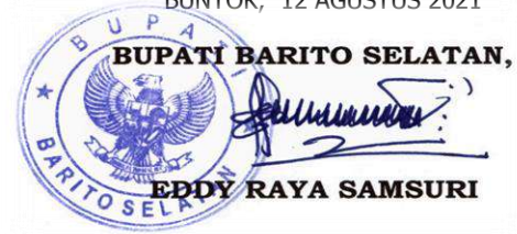
EDDY RAYA SAMSURI