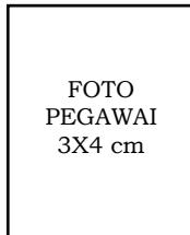
FOTO PEGAWAI 3X4 cm