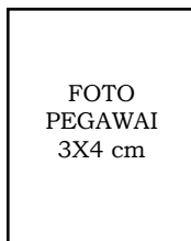
FOTO PEGAWAI 3X4 cm