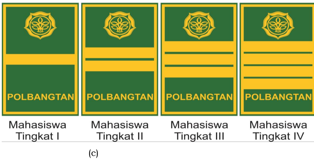
Gambar 3. topi mutz laki-laki (a), topi mutz perempuan (b), dan pangkat/dek PSH/PSU (c)