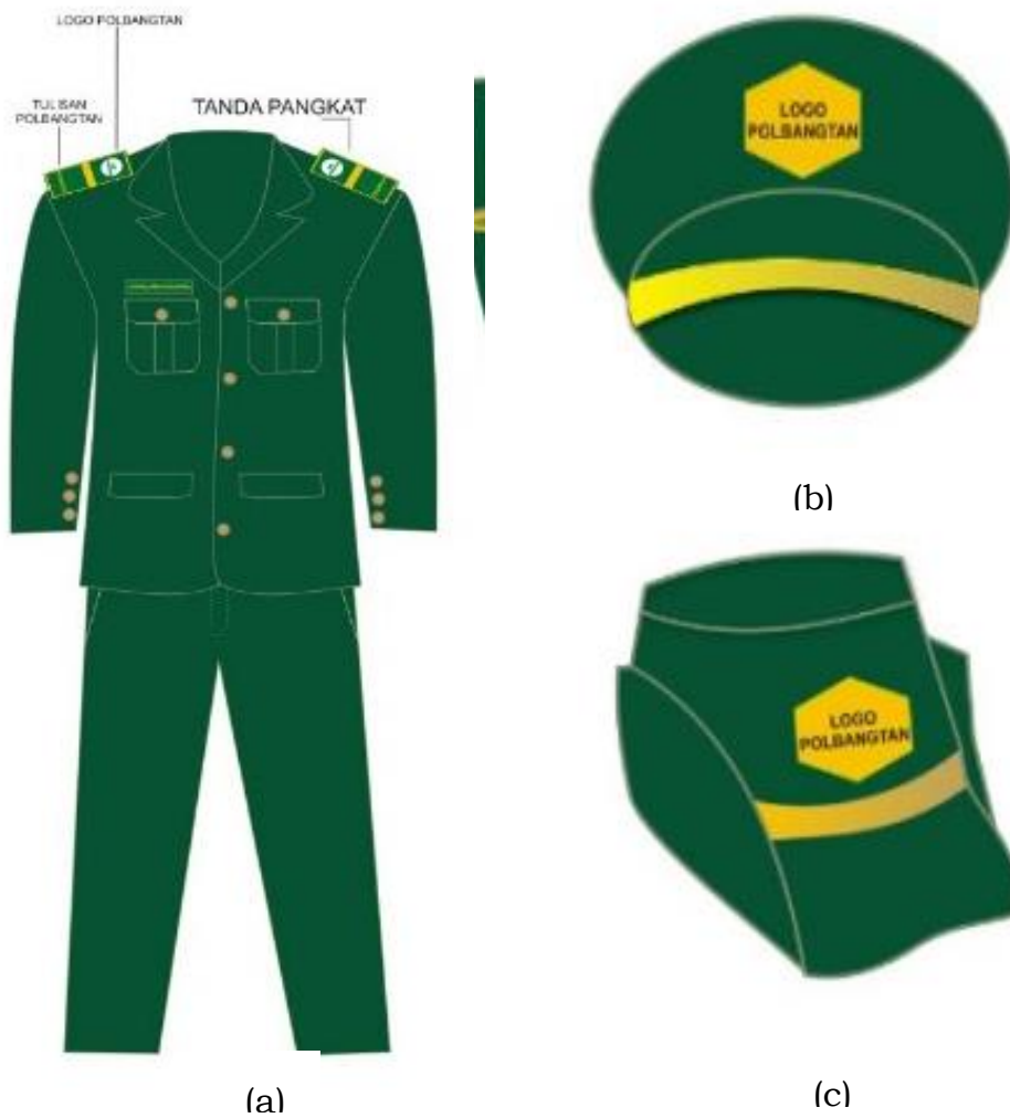
Gambar 1. PSU (a), topi pet laki-laki (b) dan topi pet perempuan (c)