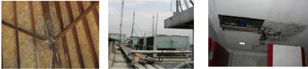
Gambar L-2. Kerusakan Sedang

Kerusakan sedang adalah kerusakan pada sebagian komponen non-struktural, dan atau komponen struktural seperti struktur atap, lantai, dan lain-lain.