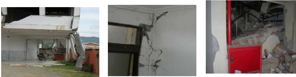
Gambar L-3. Kerusakan Berat

Kerusakan berat adalah kerusakan pada sebagian besar komponen bangunan, baik struktural maupun non-struktural yang apabila setelah diperbaiki masih dapat berfungsi dengan baik sebagaimana mestinya.