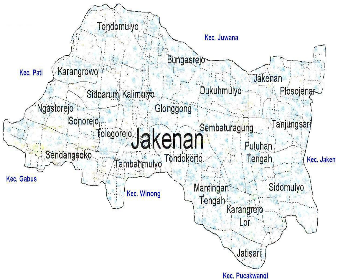
Peta Wilayah Kecamatan Jakenan

Kawasan perencanaan yang menjadi lingkup kerja Kecamatan Jakenan dapat dilihat dalam tabel II.4 berikut ini :