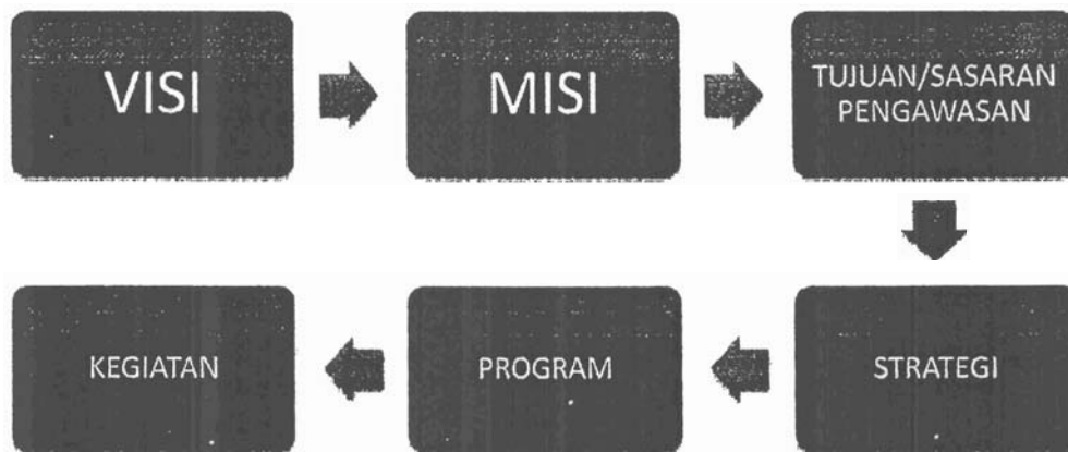
Gambar 1: Penyusunan Rencanz Strategis

10 Prosedur tersebut di atas dapat digambarkan sebagaimana terdapat pada Gambar 1 di bawah ini.