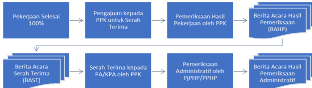
Gambar 5.1 Bagan Alur Serah Terima