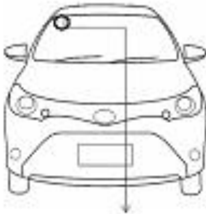
STIKER TANDA KHUSUS ANGKUTAN SEWA KHUSUS

CONTOH PENEMPATAN TANDA KHUSUS DAN KODE KHUSUS UNTUK ANGKUTAN ORANG DENGAN MENGGUNAKAN SEWA KHUSUS