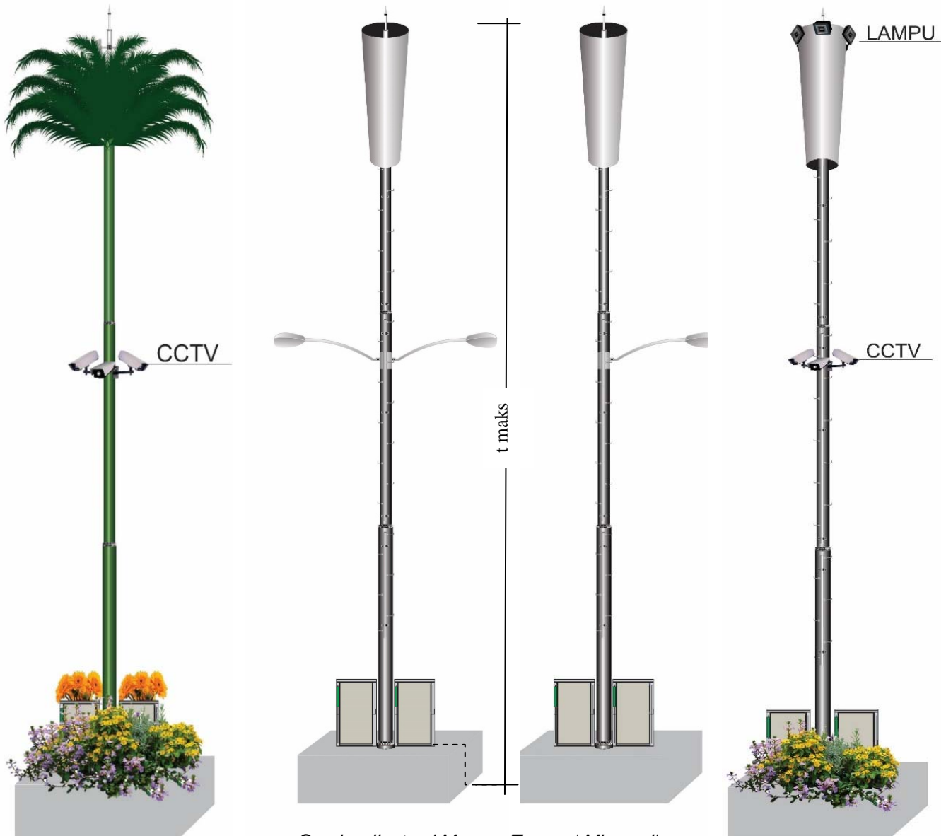
Gambar Ilustrasi Menara Tunggal Microcell