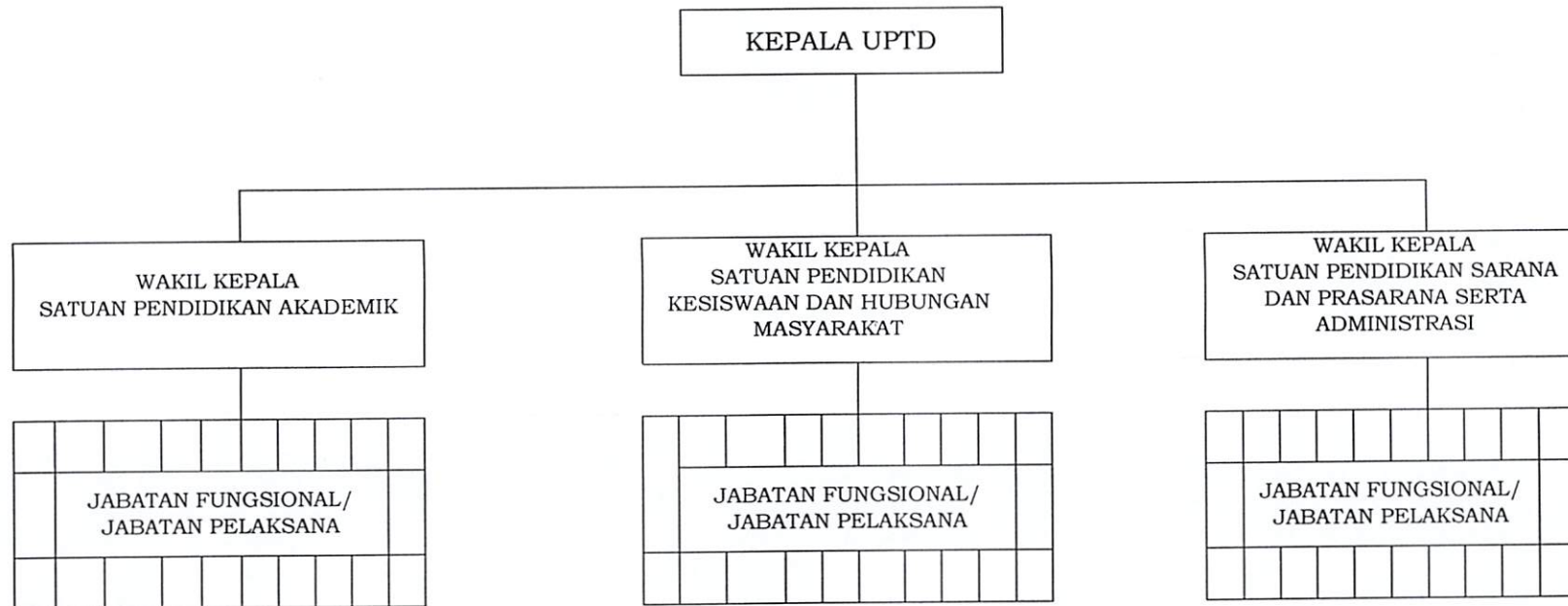
BAGAN STRUKTUR ORGANISASI UNIT PELAKSANA TEKNIS DAERAH SEKOLAH MENENGAH PERTAMA NEGERI